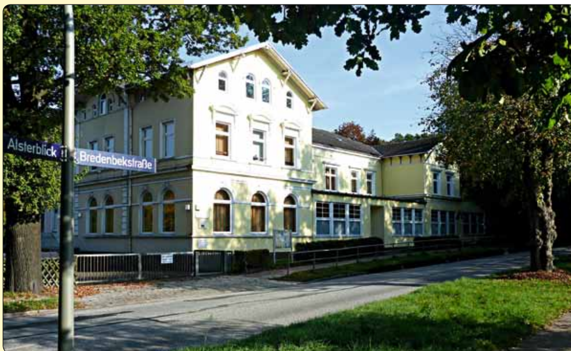
Die Freiluftschule an der Bredenbekstraße ist ein imposantes Gebäude

So also endete nach 23 Jahren die Funktion des „Waldhaus“ als Grundschule. Unzählige Jungen und Mädchen verlebten in