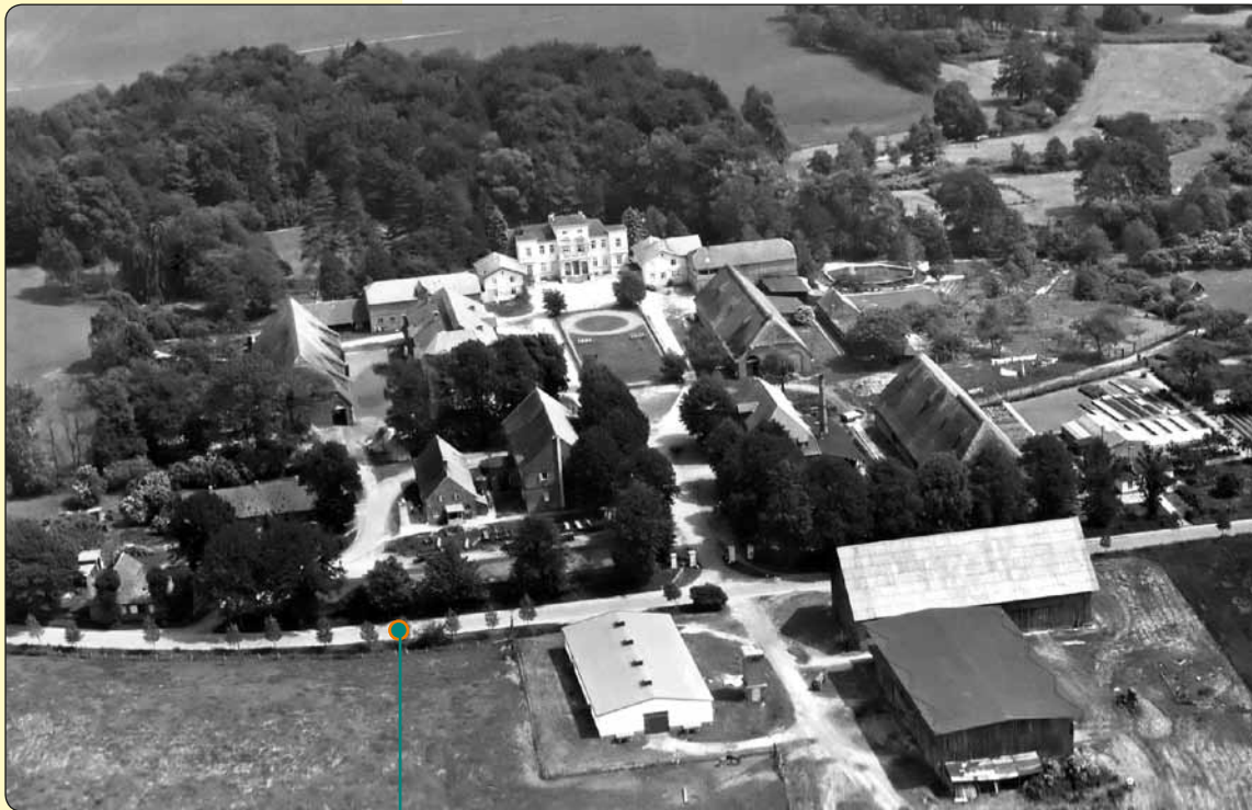
Luft-Aufnahme von 1956

Im Juli des gleichen Jahres wurde das Gut dann mit 250 ha an private Pächter übergeben. Es wurde am 01. April 1991 als Bioland-Betrieb anerkannt. Der größte Anteil der Flächen wird ackerbaulich, kleinere Bereiche gartenbaulich und als Weide für Tiere genutzt. Zur Tierhaltung gehören Rinder (Deutsche Angus), Legehennen, Gänse und Schweine. Es gibt eine Hofbäckerei, einen Lieferservice, einen Hofladen und ein Restaurant.